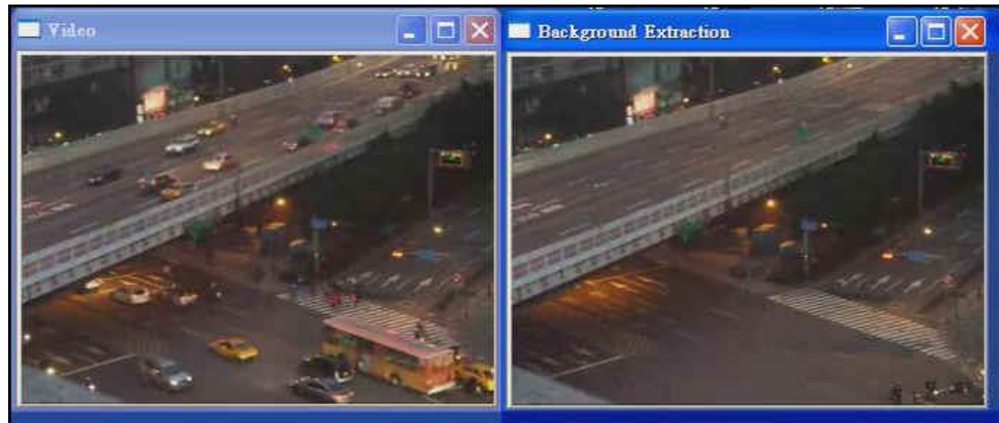
影像背景重建 Background Extraction