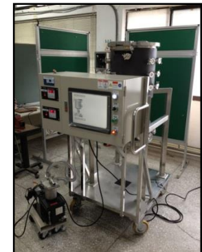
吸附式製冷系統 Adsorption refrigeration system