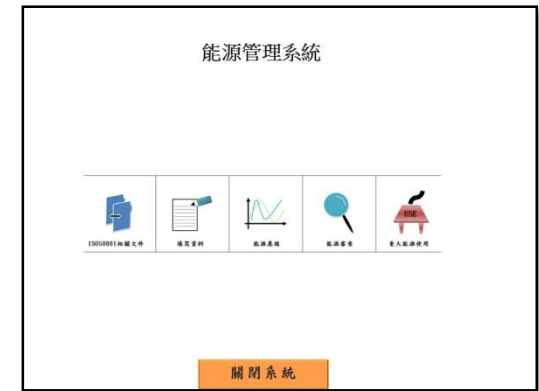
能源管理系統圖 Energy Management System Diagram